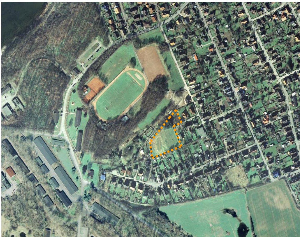
Abb. 1: Luftbild

Gemarkung Laboe – Flur 4 – Flurstücke 487/92, 907/92 und 482/92