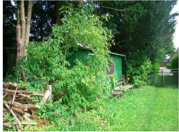
Abb. 3: Schuppen und Zufahrt (Stoschstraße)