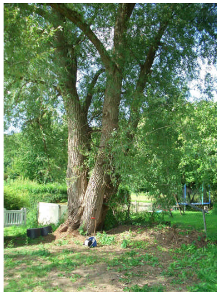
Abb. 7: Mehrstämmige Weide im Norden