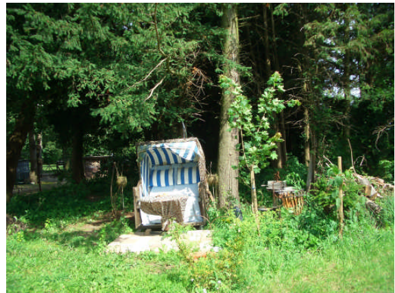
Abb. 5: Sitzplatz