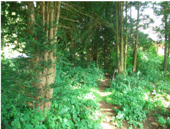
Abb. 4: Blick in den Gehölzbestand