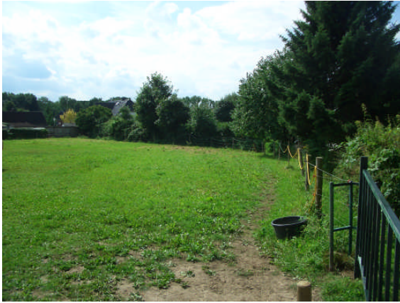
Abb. 2: Blick von der Stoschstraße nach W

hauptsächlich aus Eiben ( Taxus baccata ) und Douglasien ( Pseudotsuga menziesii ) sowie einer größeren Eiche ( Quercus robur ) zusammen. Im Unterwuchs kommen auch einige Laubgehölze ( Sambucus nigra , Prunus avium ) vor. Außer dem genannten Schuppen befindet sich ein kleiner Sitzplatz am Rande des Gehölzbestandes.