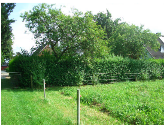
Abb.6: Nachbargrundstück 7b