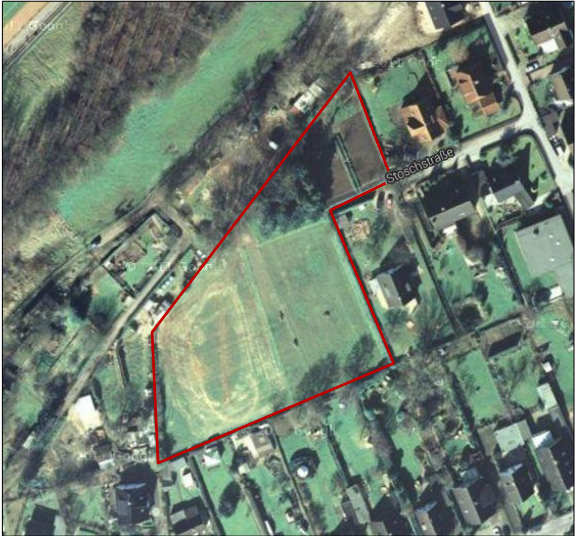
Luftbild von 2007