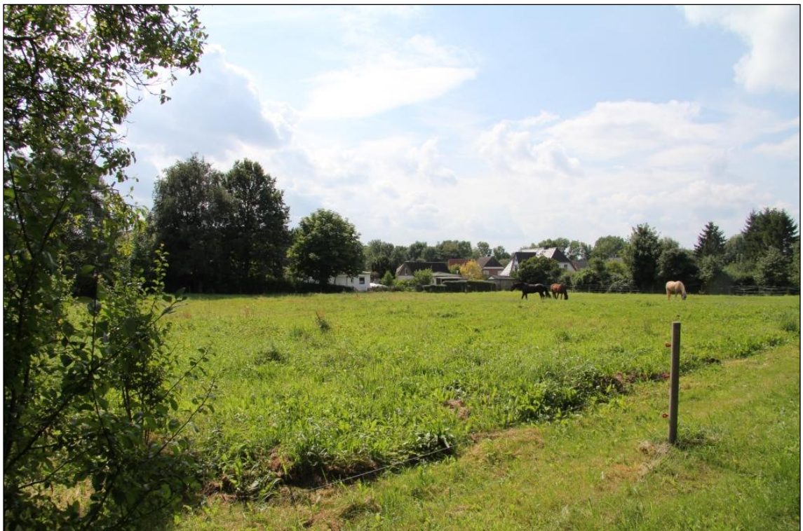
Blick auf das Plangebiet vom westlichen Ende der Stoschstraße nach Südwesten