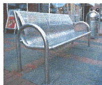
Sitzbänke Relax I, II, Fa. Mischow & Sohn als 2- und 3-Sitzer