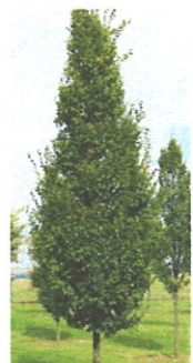
Carpinus betulus 'Frans Fontaine'

MASSTAB 1:50 ZEICHEN IK DATUM 31.05.2021 PLAN NR. 21-11-32 A